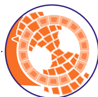
ਫੈਲਣ ਵਾਲਾ ਛਾਤੀਆਂ ਦਾ ਕੈਂਸਰ