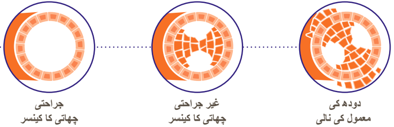
جراحی چھاتی کا کینسر

اسکریننگ کے ذریعہ چھاتی کے کینسر کی تشخیص والی 5 خواتین میں سے لگ بھگ 4 کو جراحی کینسر ہوگا۔ یہ ایسا کینسر ہے جو دودھ کی نالیوں سے بڑھ کر گردوپیش کی چھاتی میں پھیل جاتا ہے۔ چھاتی کے زیادہ تر جراحی کینسر کا علاج نہ کروانے پر یہ جسم کے دیگر حصوں میں پھیل جائیں گے۔